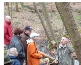
Sortie en Forêt de Compiègne aux étangs de Sainte Perrine.

Retrouvez nous sur le web http://albbaugy.jimdo.com/brocante/