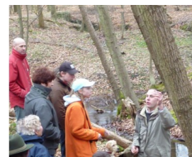
Sortie en Forêt de Compiègne aux étangs de Sainte Perrine.

Retrouvez nous sur le web http://albbaugy.jimdo.com/brocante/